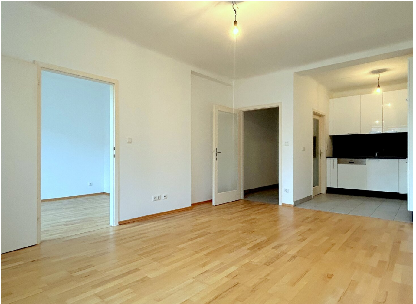
Wohnzimmer mit Küche