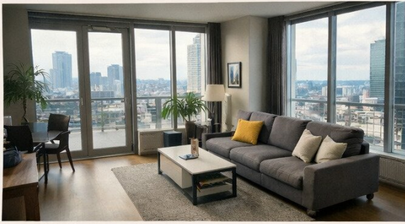
Moderne Wohnungen im Hochhaus