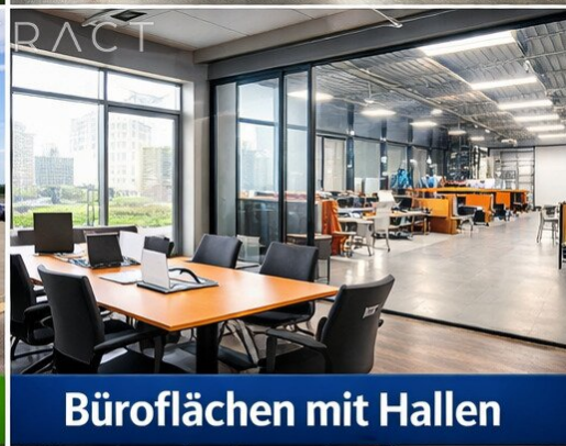
Büroflächen mit Hallen