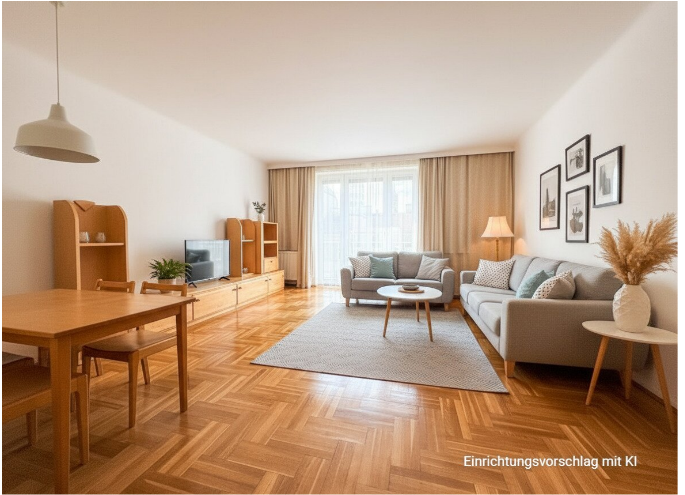
Einrichtungsvorschlag mit KI