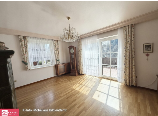
KI-Info-Möbel aus Bild entfernt