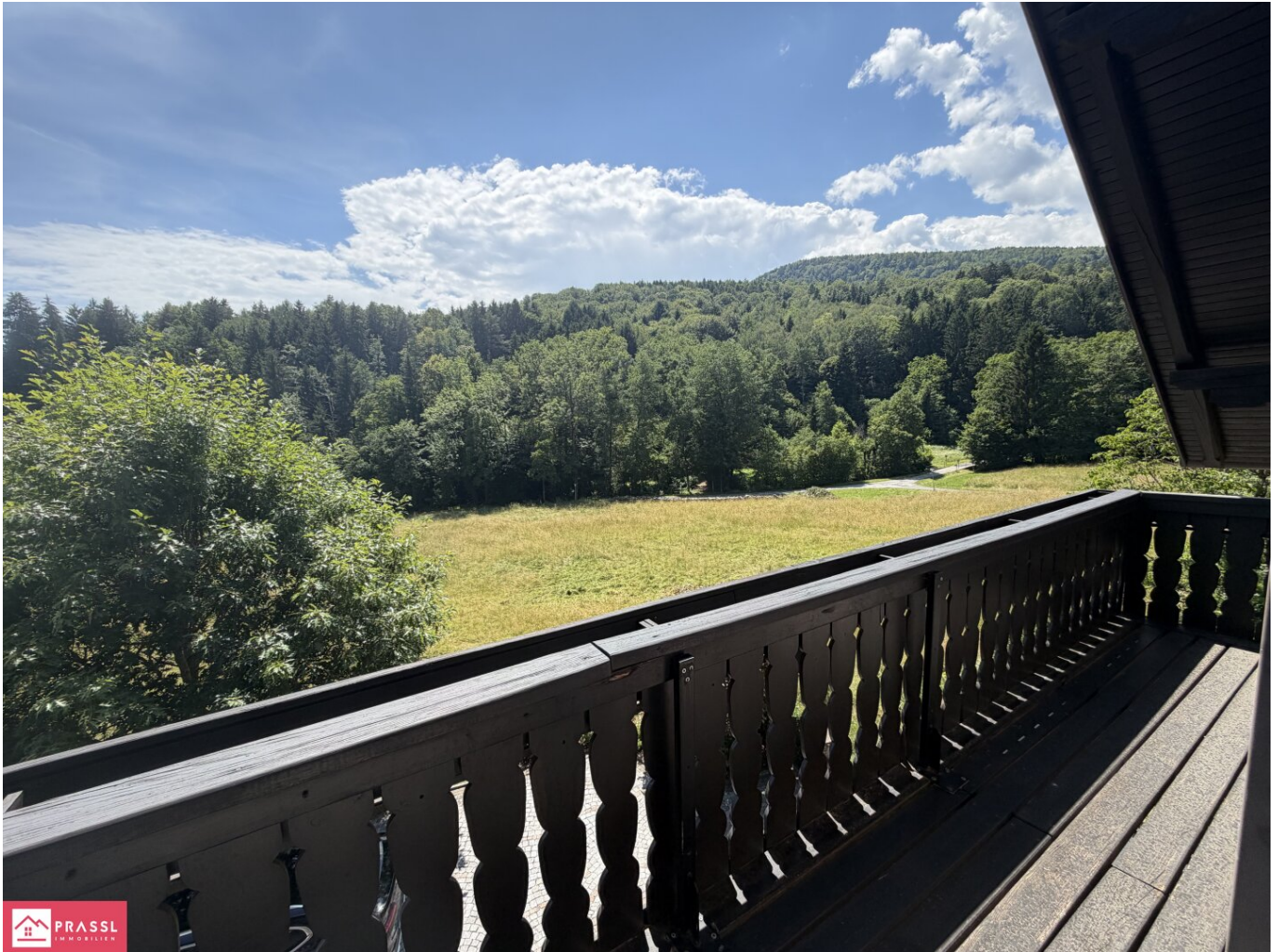
Aussicht vom Dachgeschoss-Balkon

Viel Platz für die Familie mit 10 Zimmern und landwirtschaftlicher Fläche! Jetzt kaufen!