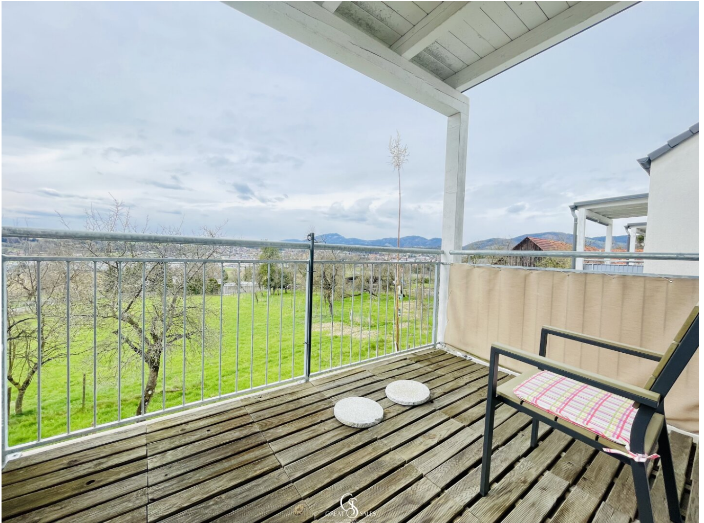
Terrasse mit Ausblick