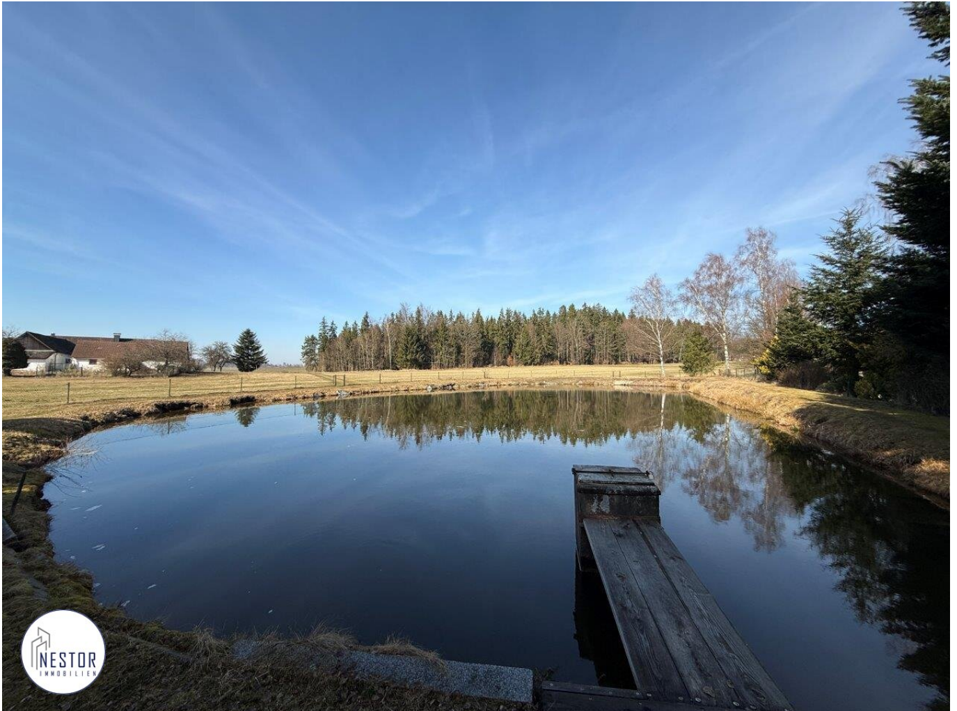
Fischteich - NESTOR Immobilien