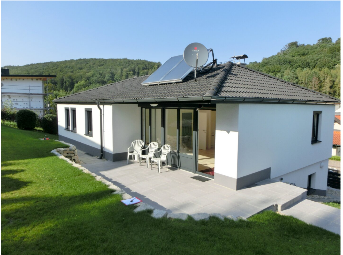
Hausansicht vom Garten