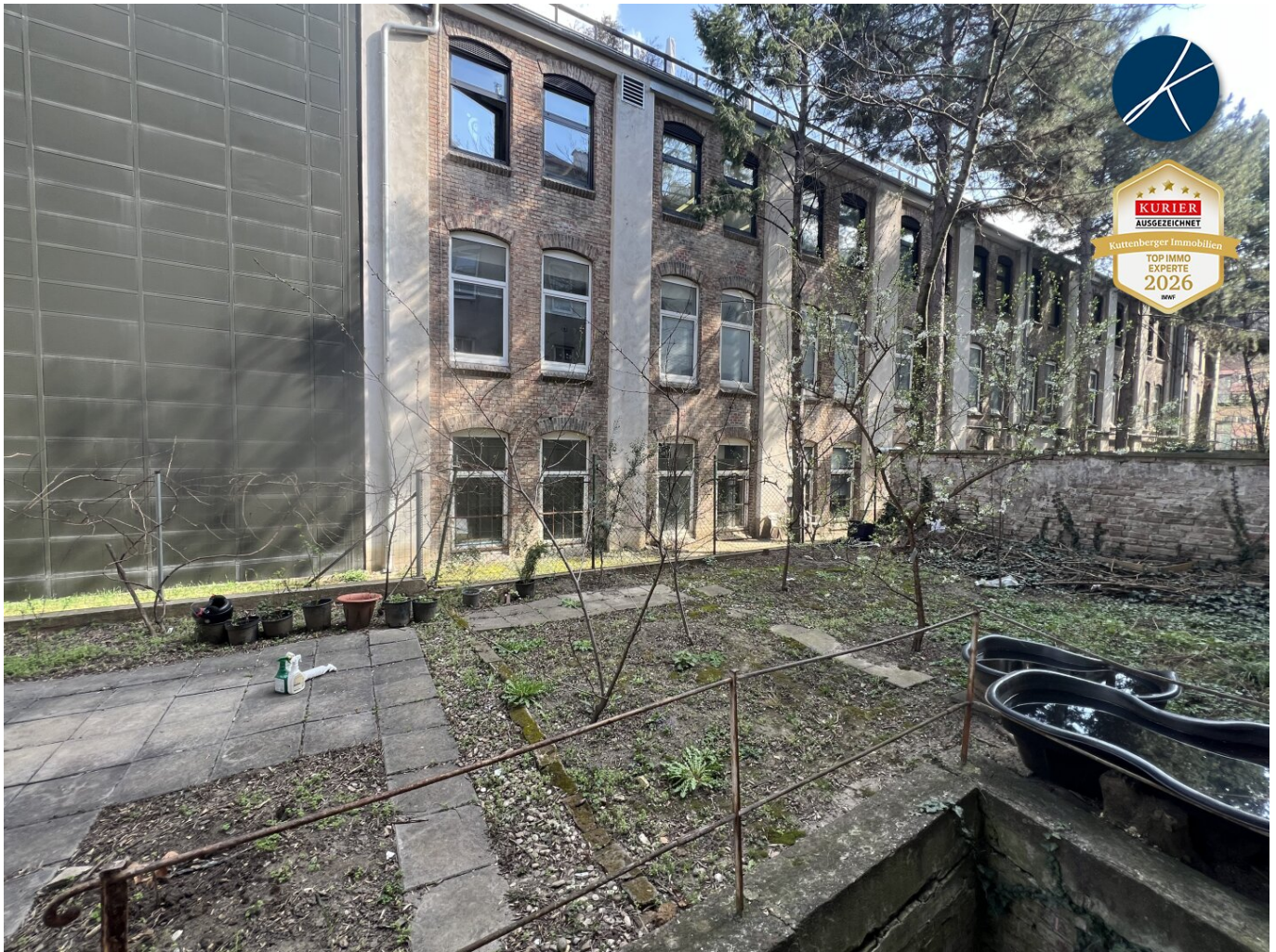
Garten mit Terrassen