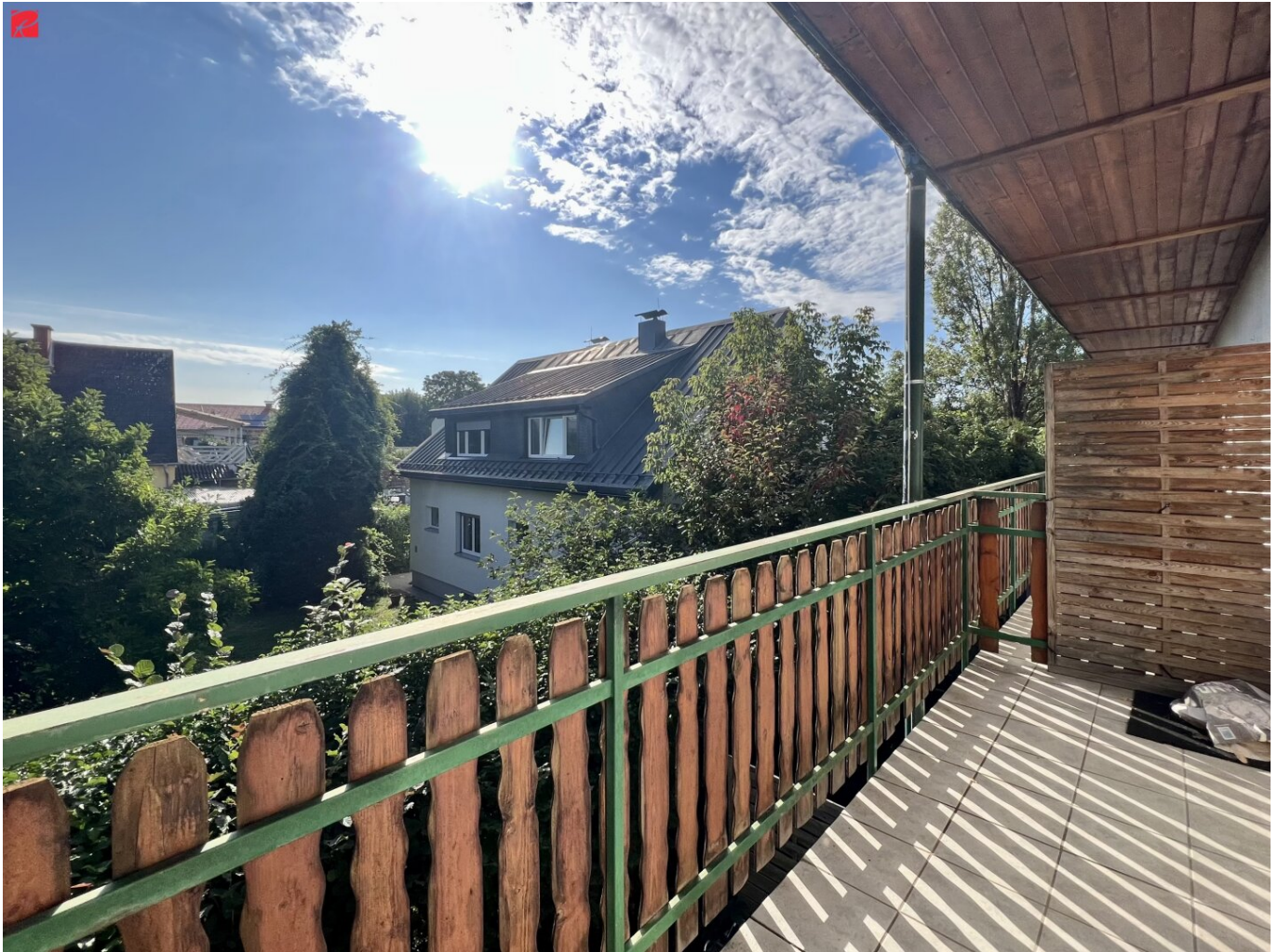
Balkon mit Aussicht