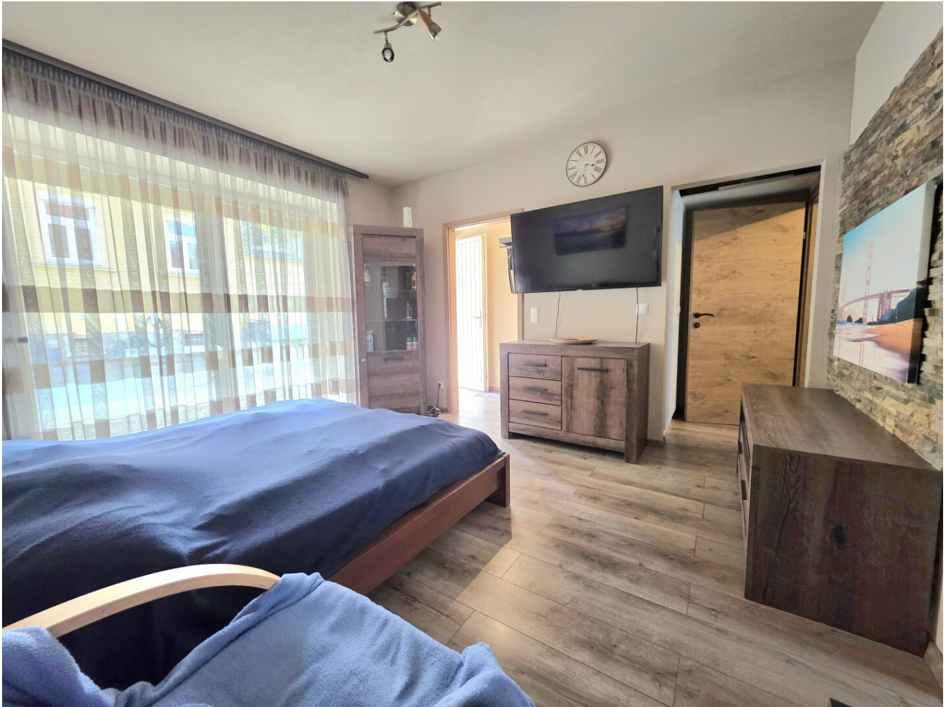
Wohn- und Schlafzimmer