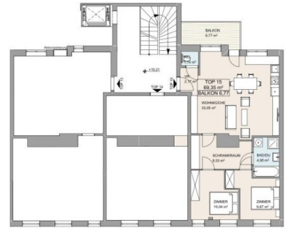
LAGEPLAN 1/200 PILGRAMGASSE 15