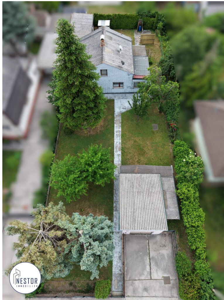
Grundstück - NESTOR Immobilien