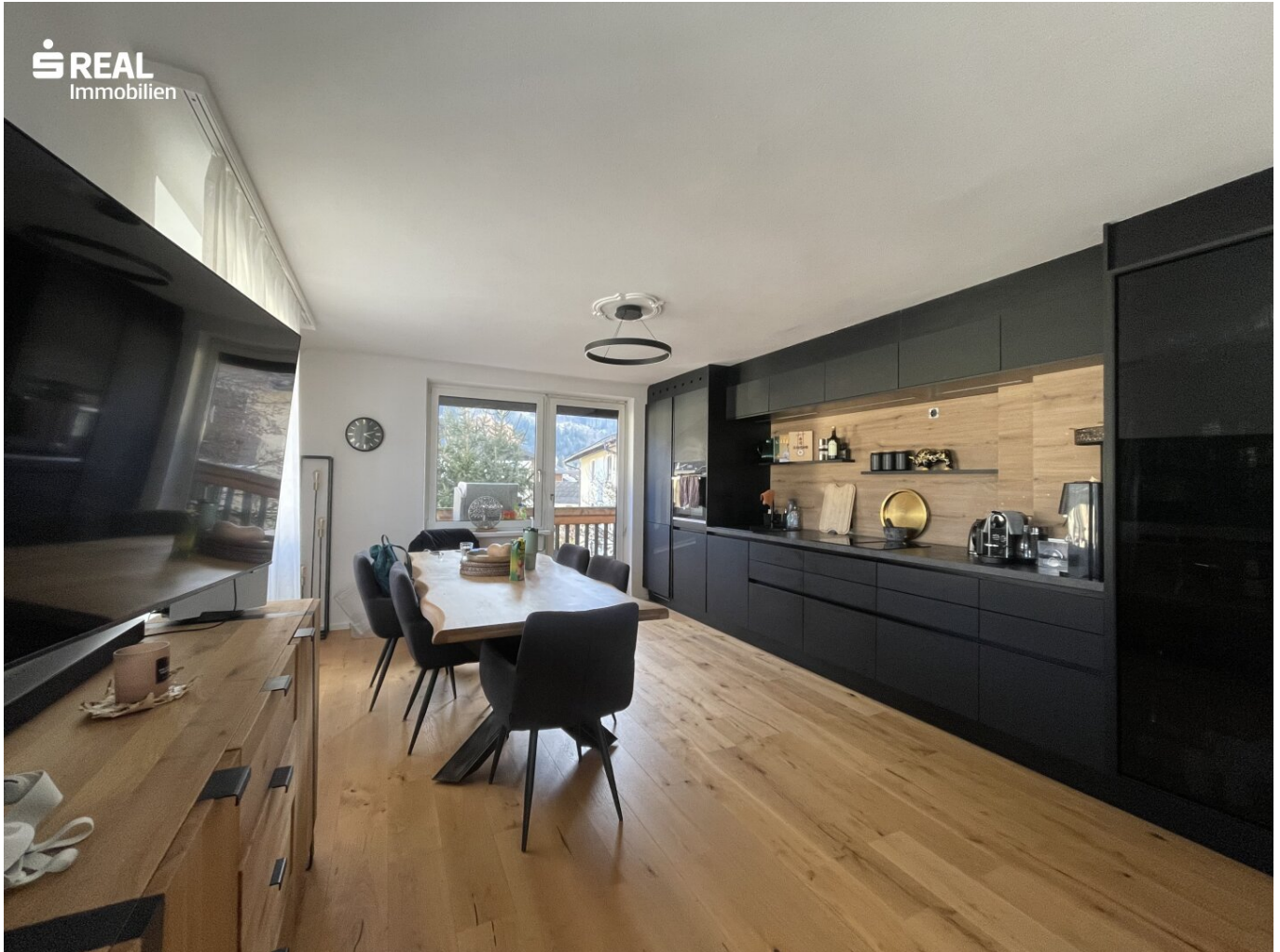
Wohnzimmer mit offener Küche

Objektnummer: 960/74667 Eine Immobilie von s REAL