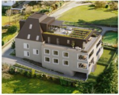
Kleinwohnanlage Langegasse 3 Dornbirn