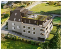
Kleinwohnanlage Langegasse 3 Dornbirn