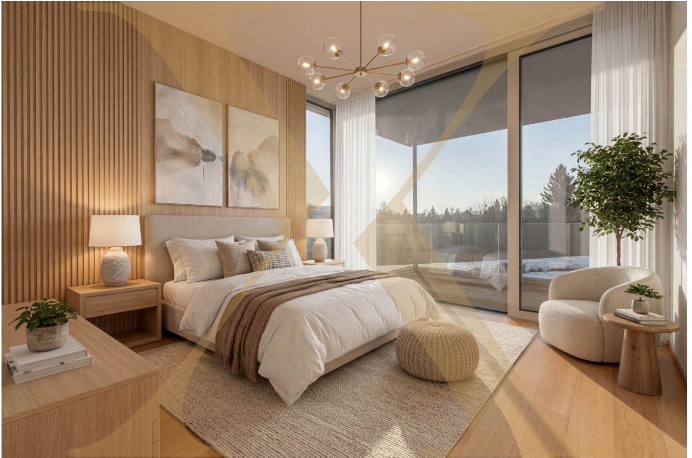
Schlafzimmer - KI-Visualisierung