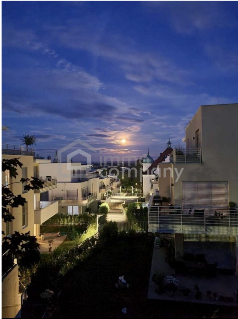
Aussicht von Balkon