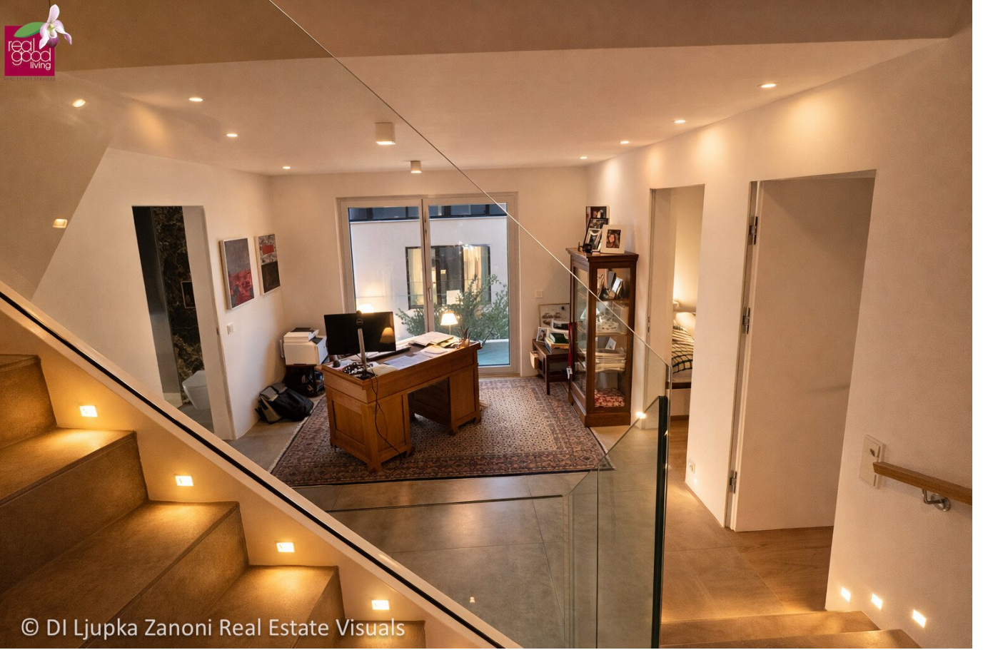
© DI Ljupka Zanoni Real Estate Visuals