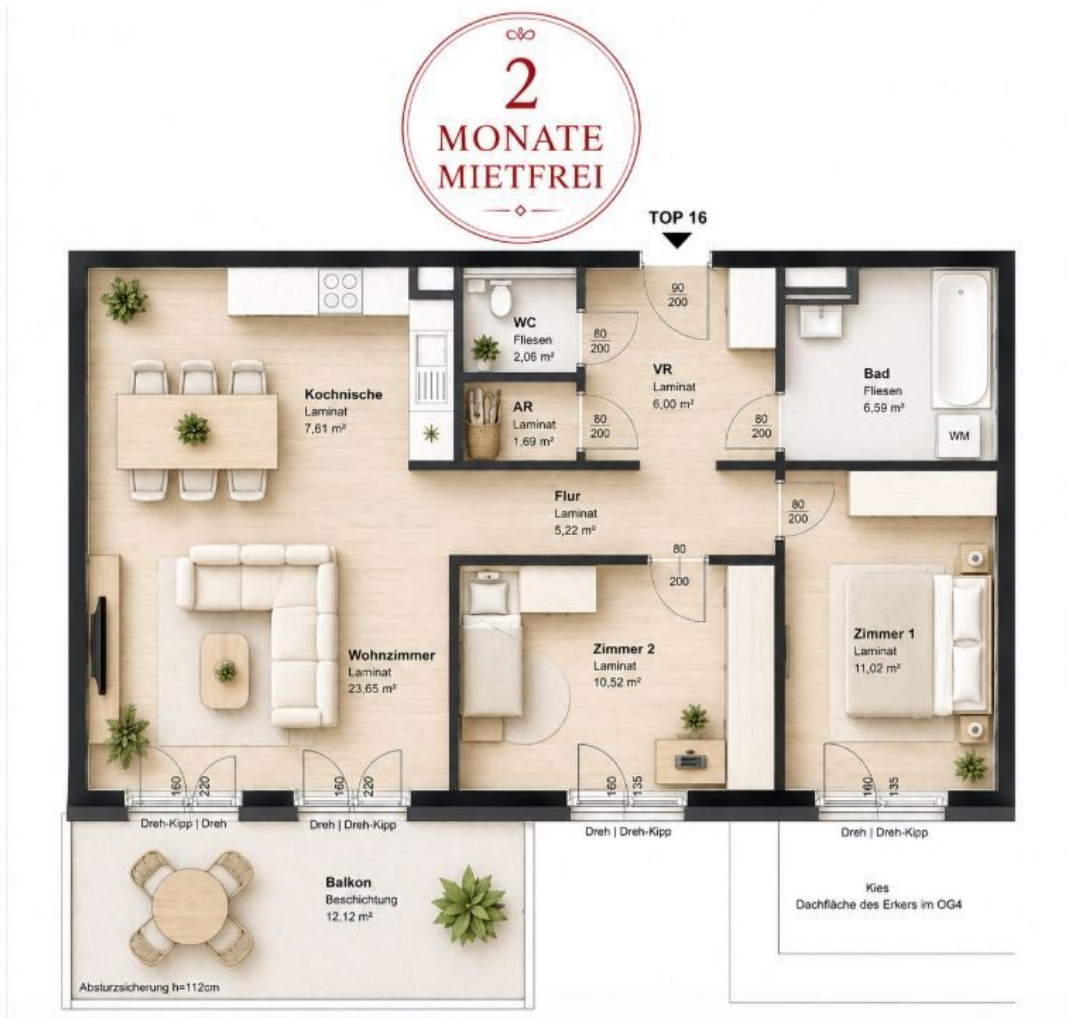
GR Top 16

Objektnummer: 141/84855 Eine Immobilie von Rustler