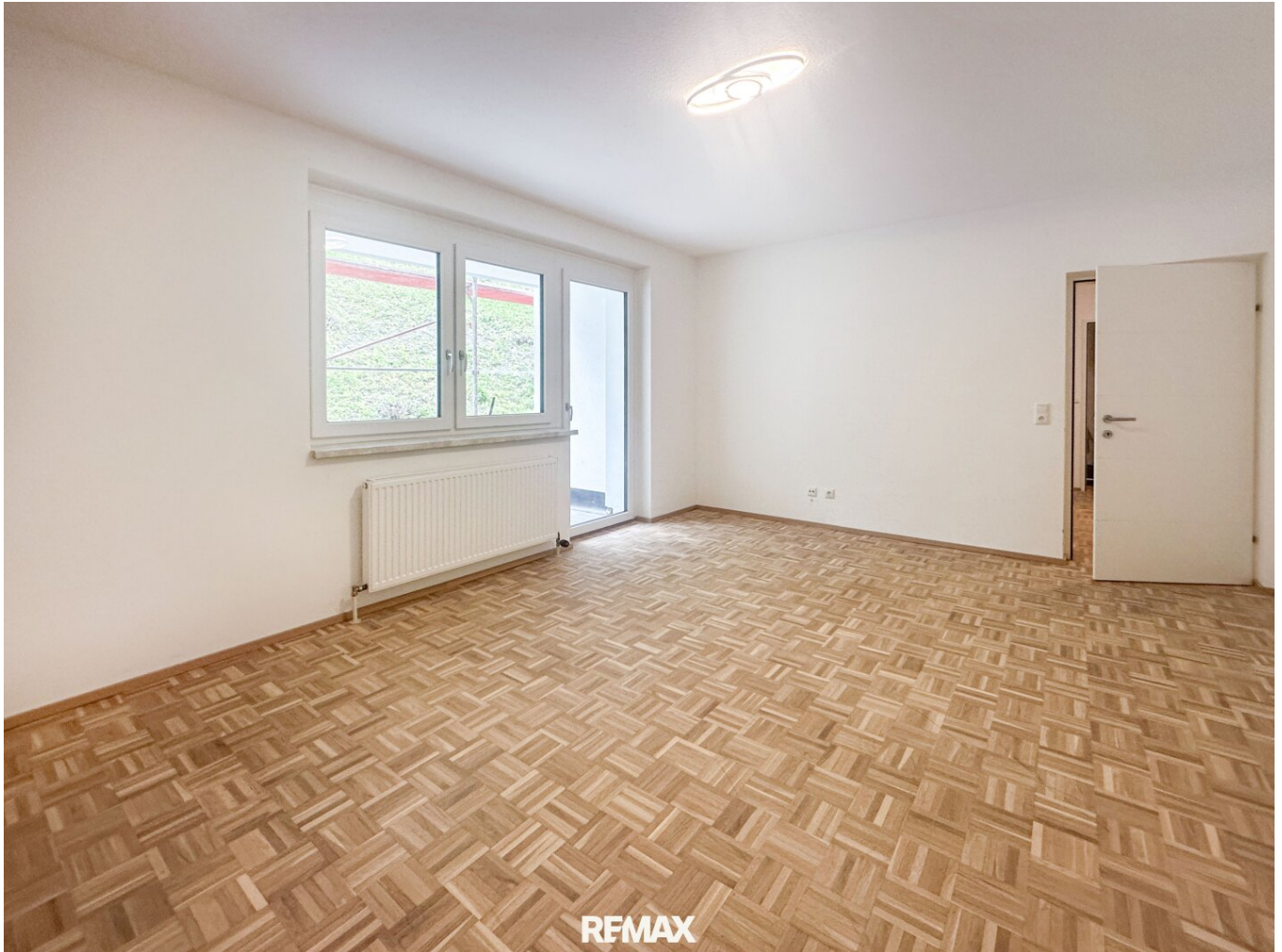
Wohnzimmer mit Ausgang auf die Terrasse