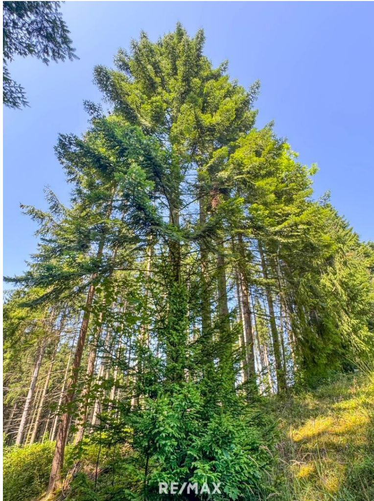
Fichtenwald mit ein paar schönen Tannen