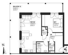
TOP 19 - 2.OG 01/110

HINTERWIRTH ARCHITECTEN | TH & B3 Immo GmbH Part of BALFIN GROUP