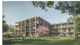
D:R | S:R | T:R

Maßstab der Boden- und Wandbilder: wenn der Dreifach-, Doppel- & Vierfach-Anschluß gilt ausschließlich die jeweils aktuelle Regel für Anschlussleistungen. Grundfläche: Grundrissangegebene Fläche für die Raumabgrenzung gilt immer nicht abgedeckte Platten- und Kleberflächen enthaltenen Kanten sind nicht für die Bemessung mit Eigenlasten einzurechnen. Ausnahme: Balken!