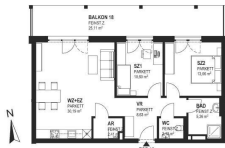
TOP 18 - 2.OG 01/110

HINTERWIRTH ARCHITECTEN | TH & B3 Immo GmbH Part of BALFIN GROUP