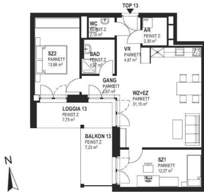
TOP 13 - 1.OG M1:100