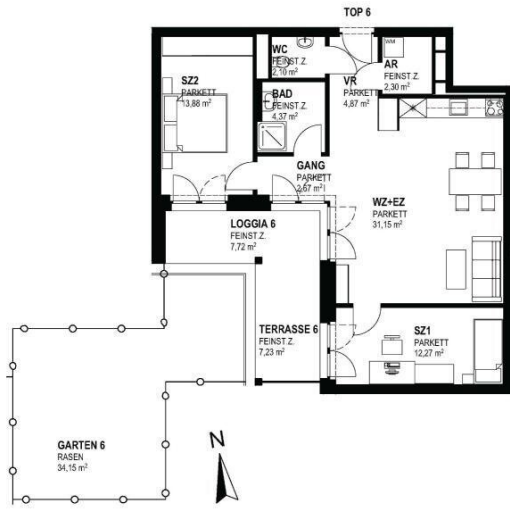
TOP 6 - EG M1:100