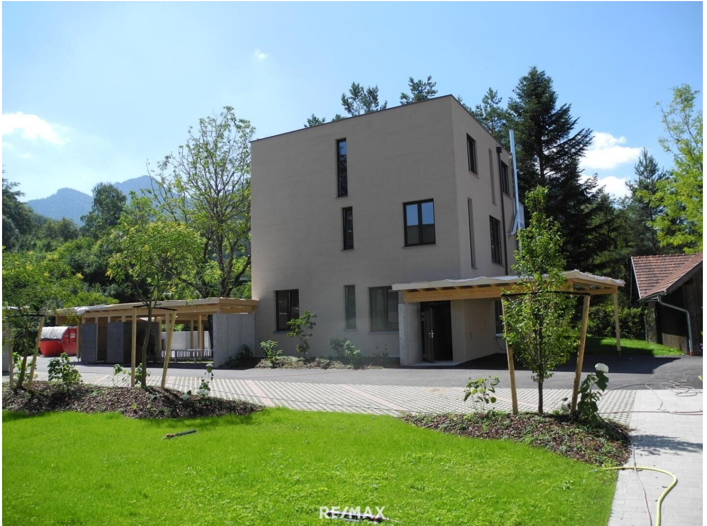
Gebäude mit Kellerzugang - Türe rechts EG