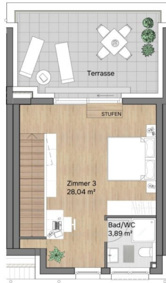
Dachgeschoss Raumhöhe 2,53 m