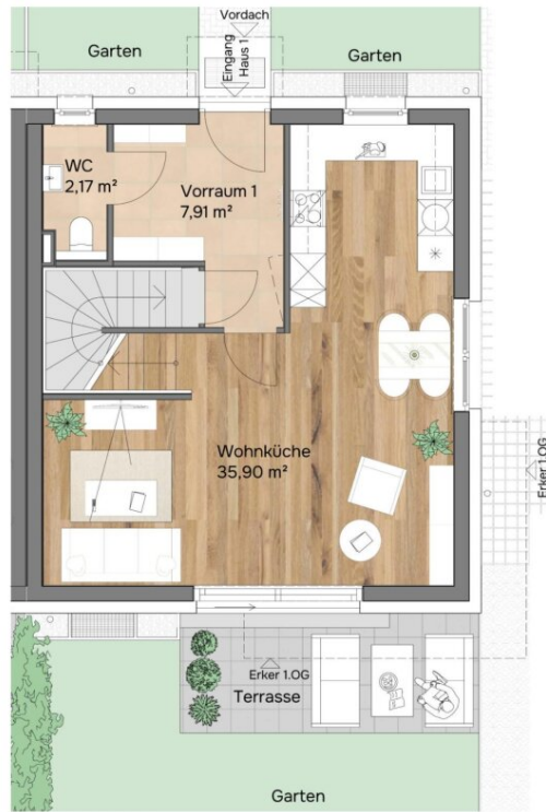
Erdgeschoss Raumhöhe 2,64 m