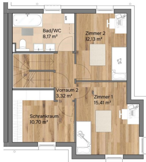
1. Obergeschoss Raumhöhe 2,53 m