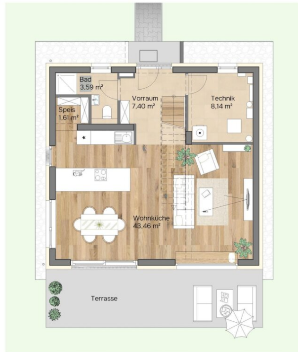
Erdgeschoss Raumhöhe 2.85 m