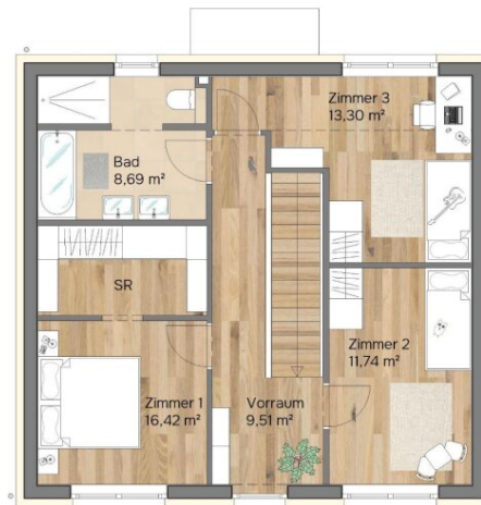
Obergeschoss Raumhöhe 2,65-3,00 m