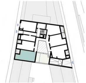
ORIENTIERUNGSPLAN | +0 ERDGESCHOSS

Hinsichtlich der elektro-, sanitär- und sonstigen ausstattungen gilt ausschließlich die jeweils aktuelle bau- und ausstattungsbeschreibung. boden- und wandbeläge sowie weitere einrichtungen sind nicht bestandteil des vertrages und dienen lediglich der veranschaulichung bzw. als vorschlag. die raum- und wohnungsgrößen können sich durch die detailplanung geringfügig ändern. alle in den plänen angegebenen abmessungen sind rohbaumaße und daher nicht für die bestellung von einbaumöbeln verwendbar - eine naturmaßnahme ist zwingend erforderlich! zusätzliche abgehängte decken und poterien erfolgen nach erfordernis, wodurch eine weitere abminderung der raumhöhe möglich ist. notwendige bauliche, behördliche, technische und konstruktive änderungen bleiben vorbehalten und haben keinen einfluss auf den vereinbarten kaufpreis. diese zeichnung bzw. ausarbeitung stellt das geistige eigentum der haring group bauträger gmbh dar und ist gesetzlich geschützt. jegliche vervielfältigung, veröffentlichung, überarbeitung, nutzung oder weitergabe an dritte im zusammenhang mit anderen projekten oder arbeiten bedarf der ausdrücklichen schriftlichen zustimmung des planers. unverbindliche plankopie - druckfehler, irrtümer und änderungen vorbehalten.