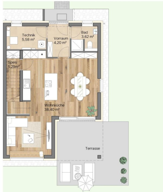
Erdgeschoss Raumhöhe 2,85 m