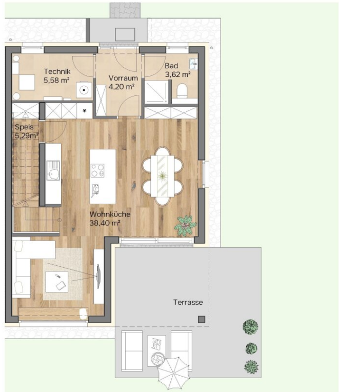
Erdgeschoss Raumhöhe 2.85 m