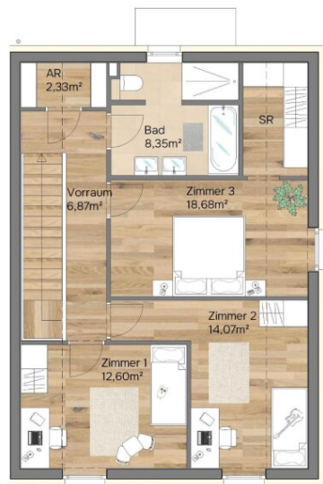
Obergeschoss Raumhöhe 2,65 m - 3,00 m