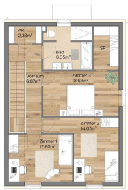
Obergeschoss Raumhöhe 2.81 m - 3.00 m