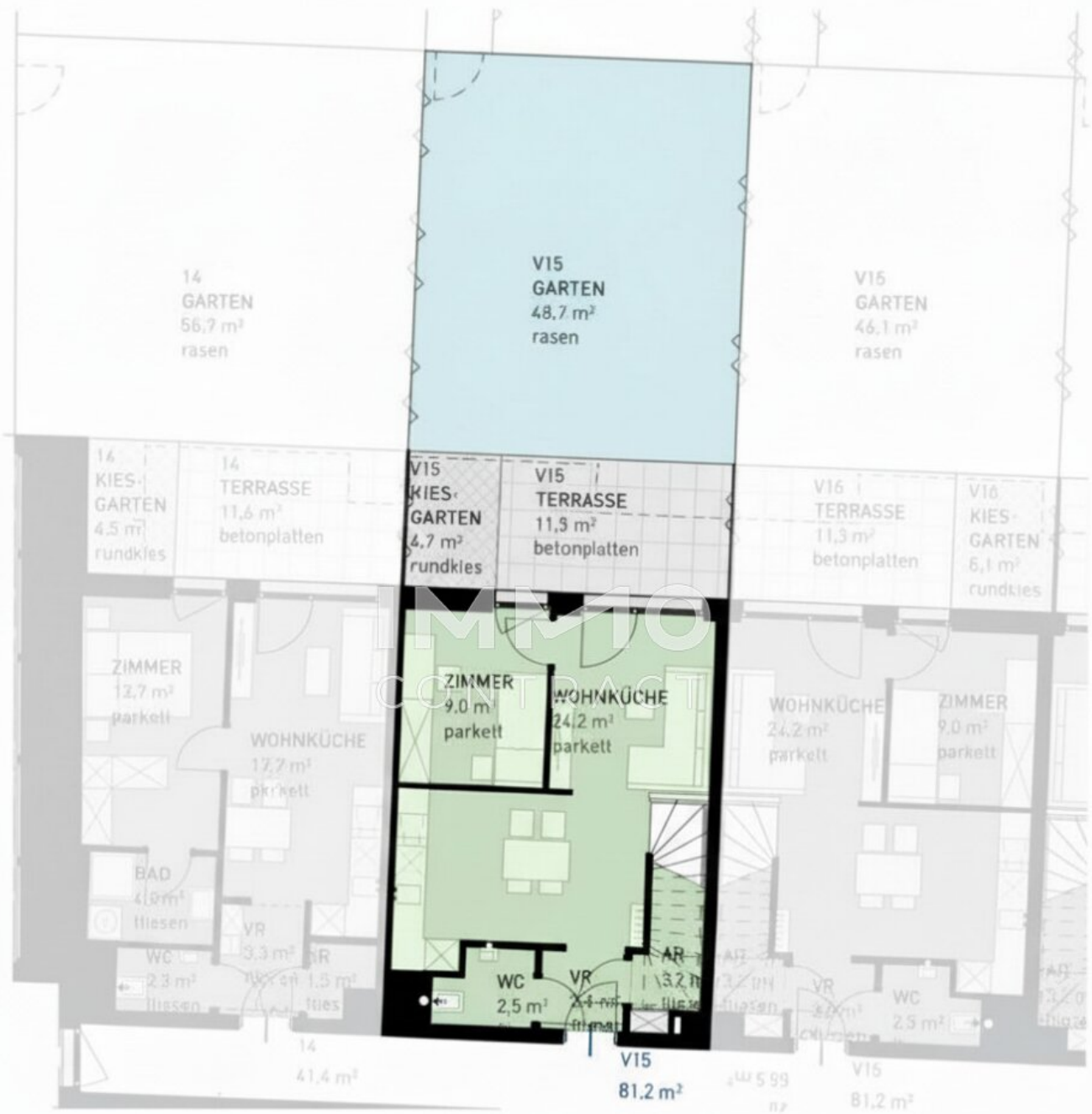
ERDGESCHOSS - MAISONETTE-VARIANTE