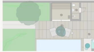
Variante mit Sauna