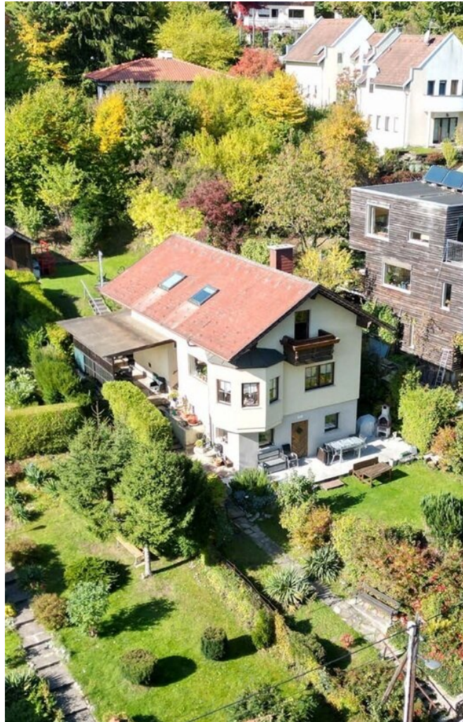
Haus im Wienerwald