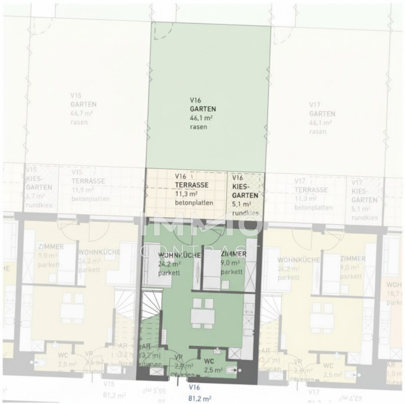
ERDGESCHOSS - MAISONETTE-VARIANTE