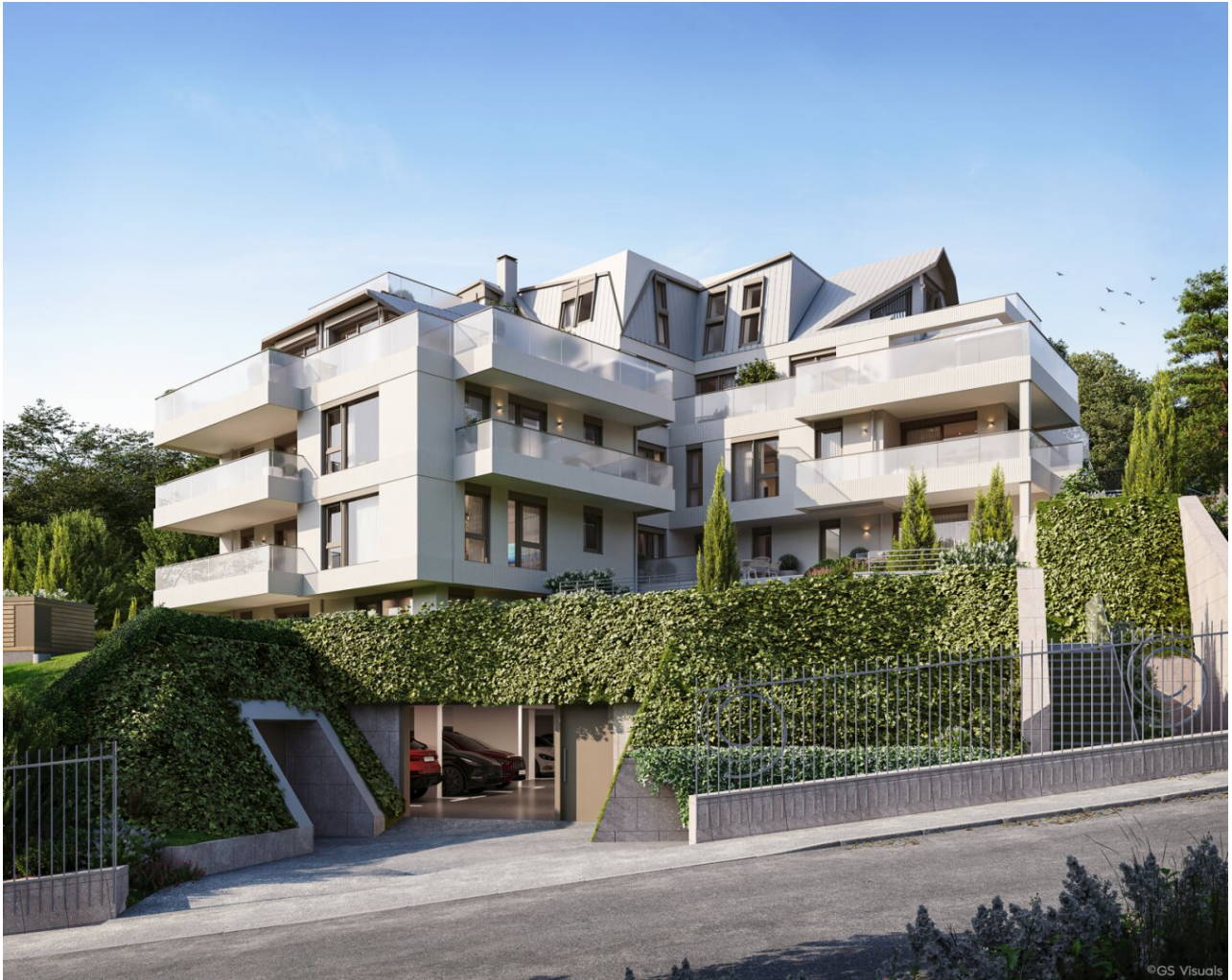
Cam 1_Cloud 9