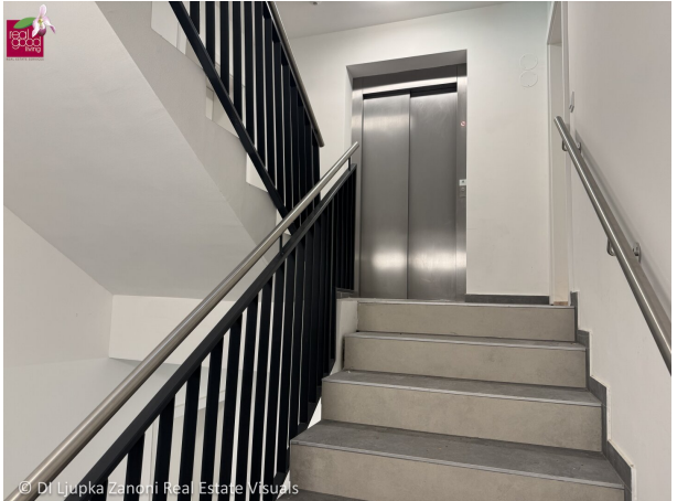
© DI Ljupka Zanoni Real Estate Visuals