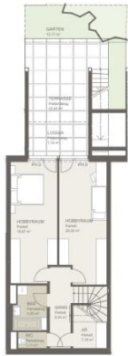
TOP 6 Übersichtplan Garten Maßstab 1:200