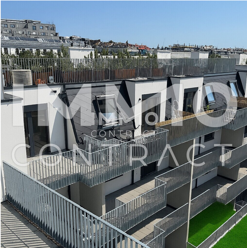
Projekt von Dachterrasse