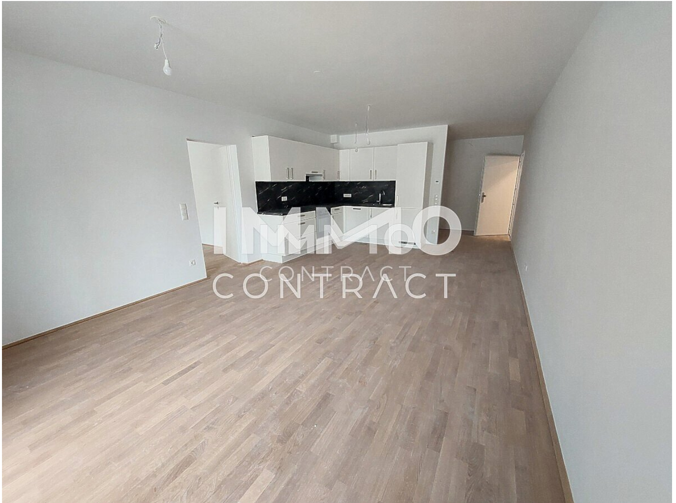
Neulaa Top 4 Wohnzimmer