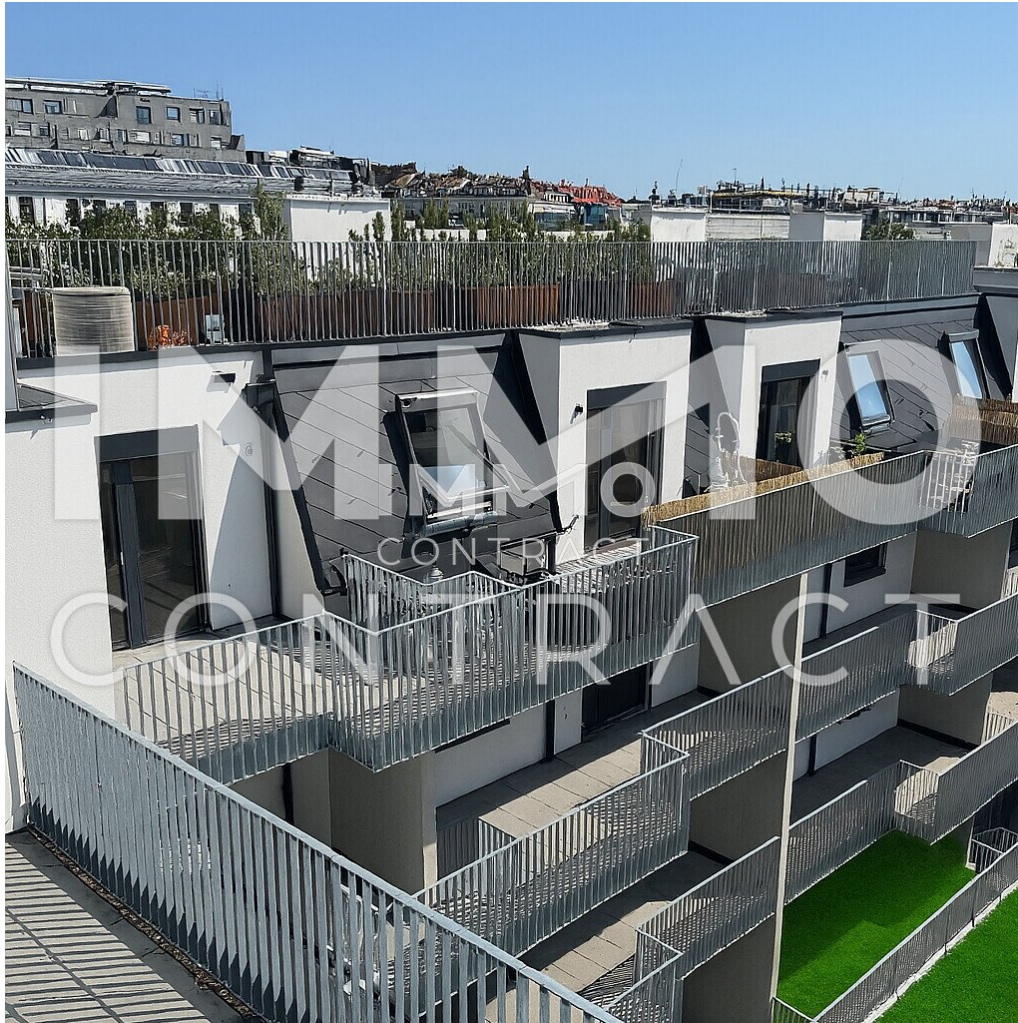
Projekt von Dachterrasse