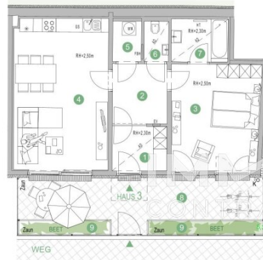
GRUNDRISS EG Eingangsniveau

PROJEKTENTWICKLUNG GG17 GMBH Ungargasse 73 FN 548160 v A-1030 Wien