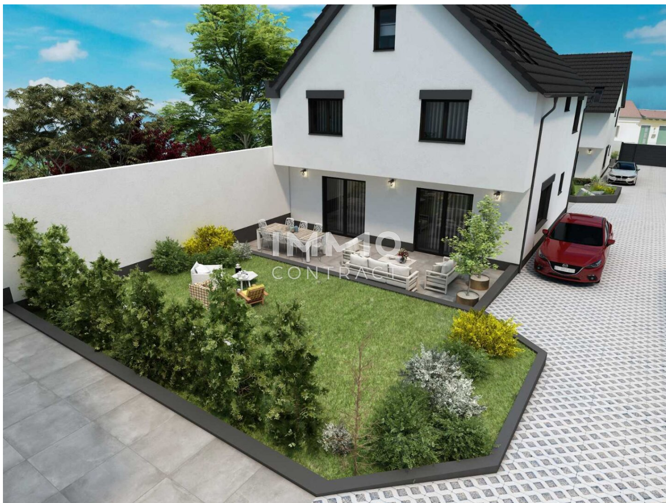
Haus 2 Gartenansicht