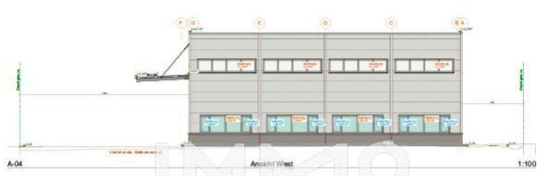
A-04 Ansicht West 1:100