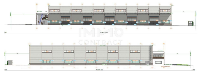
A-05 Ansicht Ost 1:100