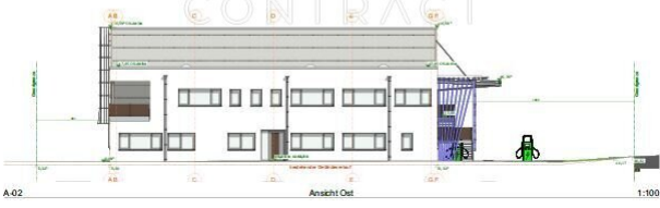
A-02 Ansicht Süd 1:100