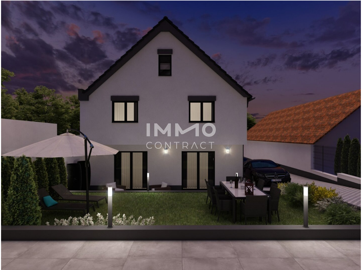
Haus 3 Dämmerung