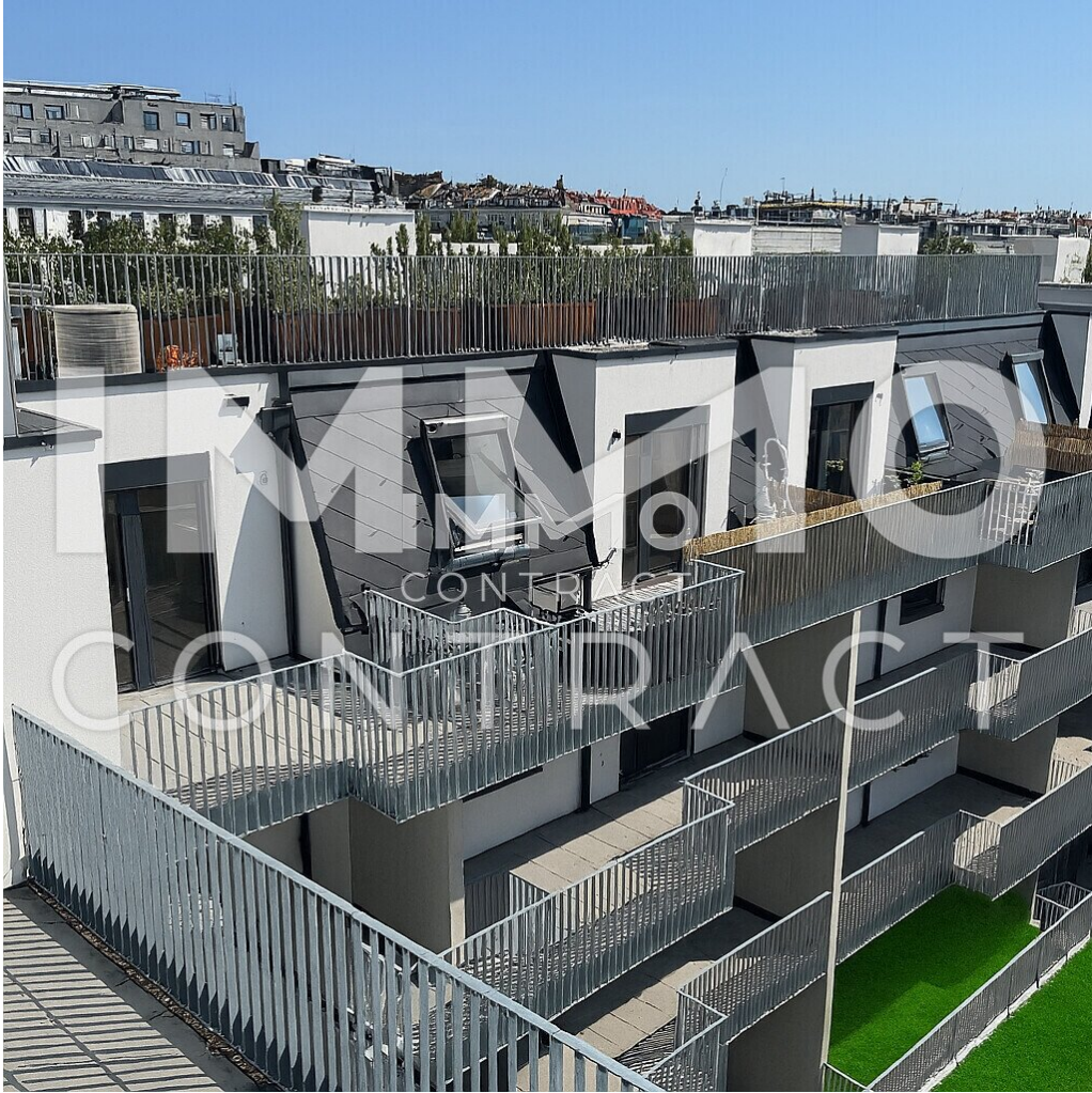
Projekt von Dachterrasse