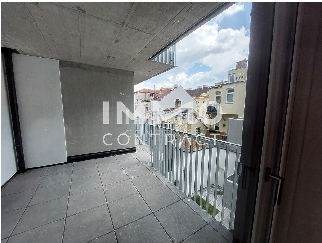
Top 18 Loggia