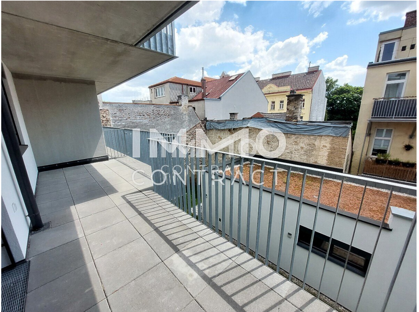
Top 20 Terrasse Teilansicht