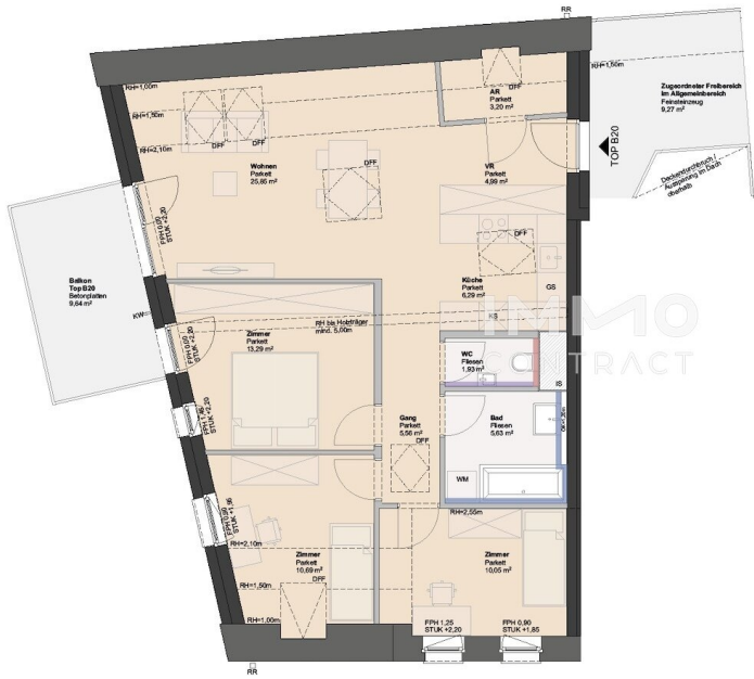
LAGE TOP B20