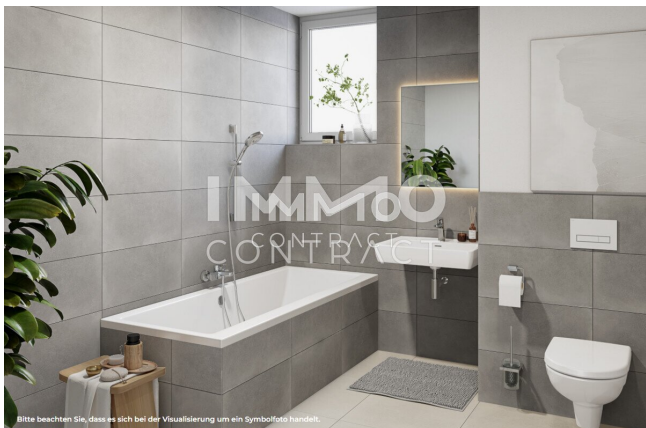
Bitte beachten Sie, dass es sich bei der Visualisierung um ein Symbolfoto handelt.