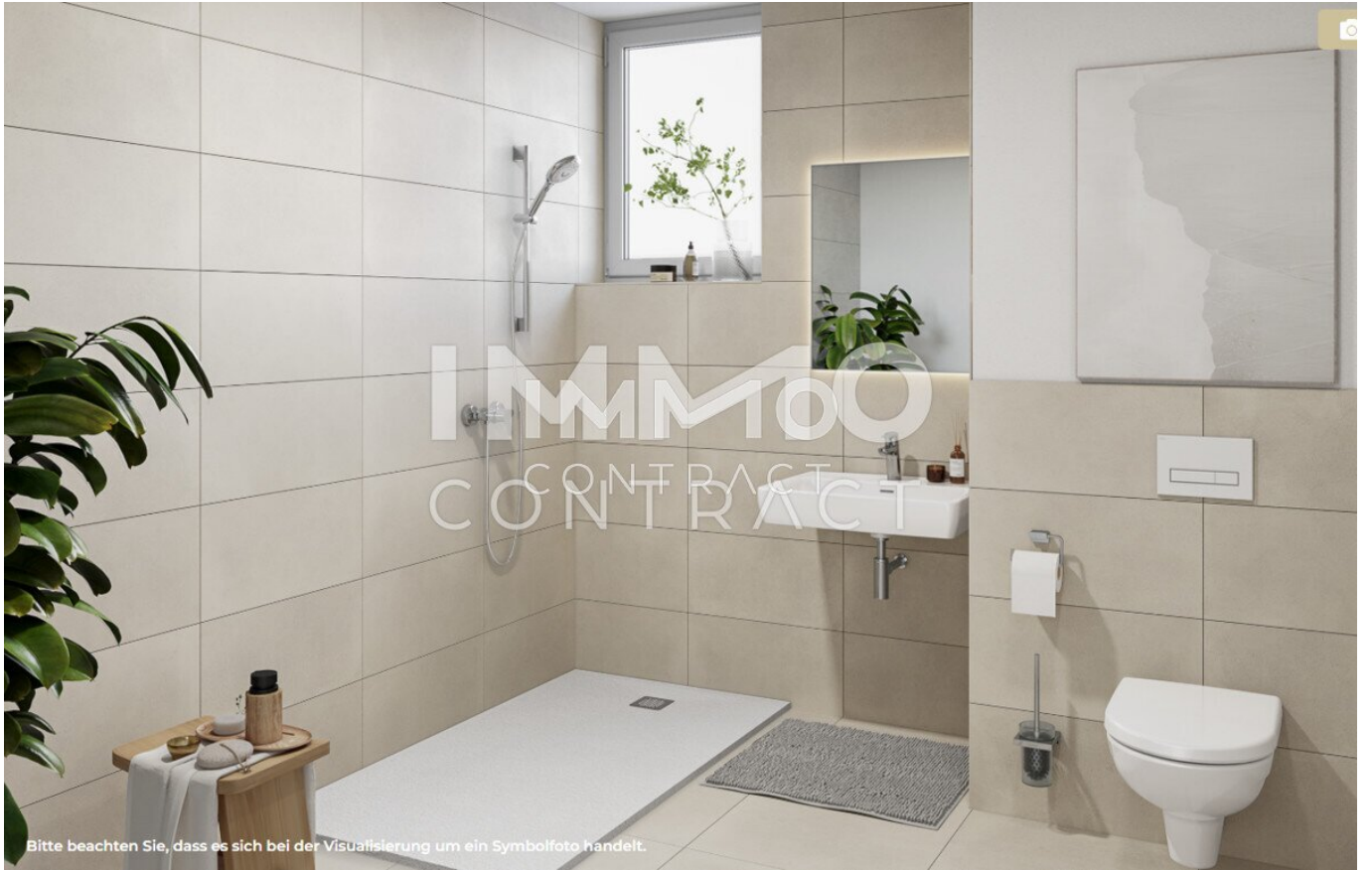
Bitte beachten Sie, dass es sich bei der Visualisierung um ein Symbolfoto handelt.