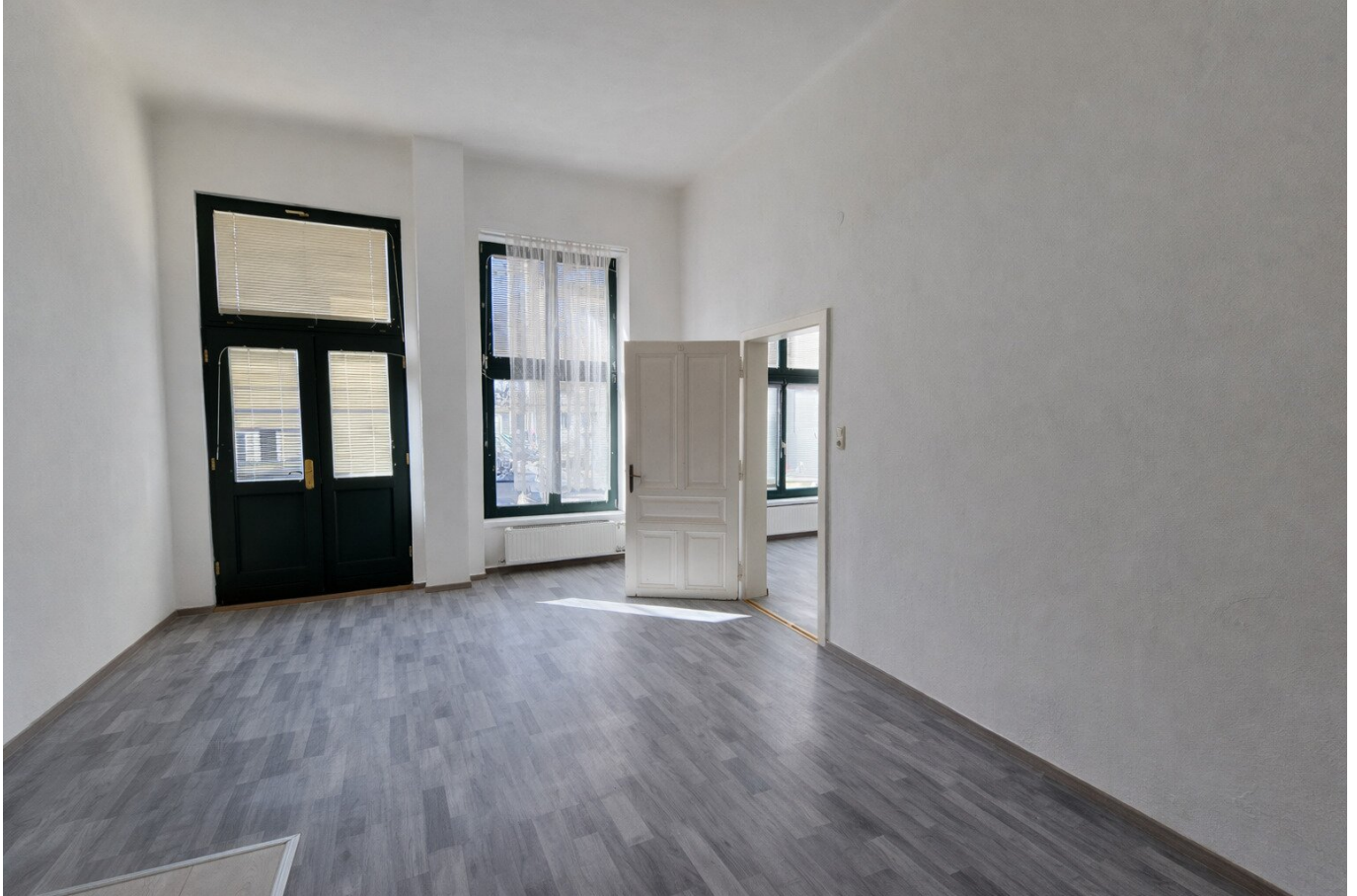
Eingang Raum 1